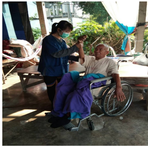
มีนักบริหารท้องถิ่นดูแลคนพิการที่บ้านติดเตียง